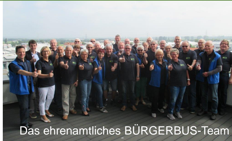
Das ehrenamtliches BÜRGERBUS-Team